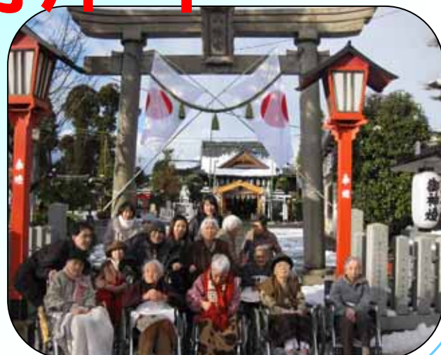
1月2日 和田八幡宮へ初詣