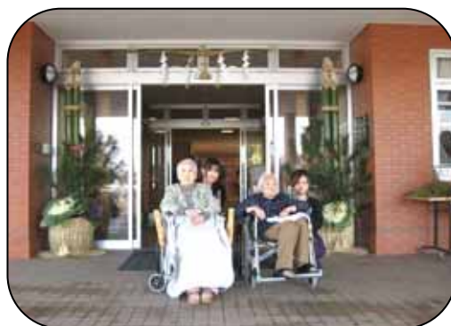
米寿の入居者と丑年のスタッフ

今年もまた、施設内のあちこちで『明るい笑顔』とたくさん出会えますことを期待しつつ、ひとことですが新年の挨拶とさせていただきます。