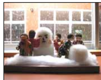
網谷幾代様の作品 (和紙人形)