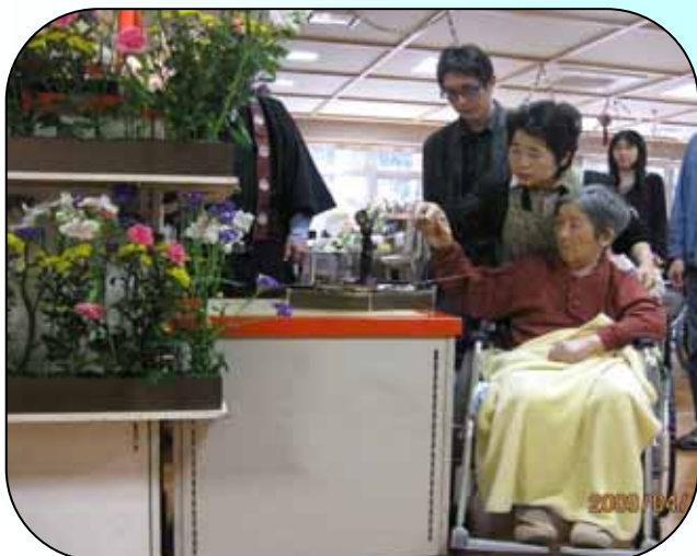
4月15日(水) 花祭り(甘茶かけ)