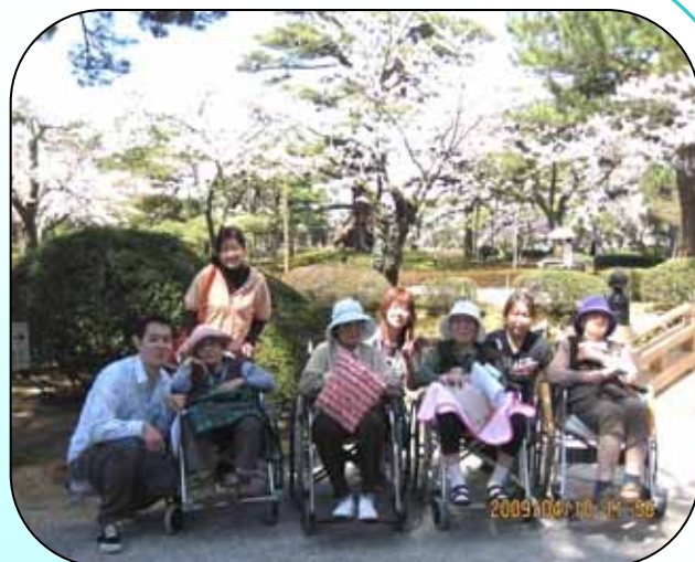
4月10日(金) 金沢兼六園(あじさいユニット)