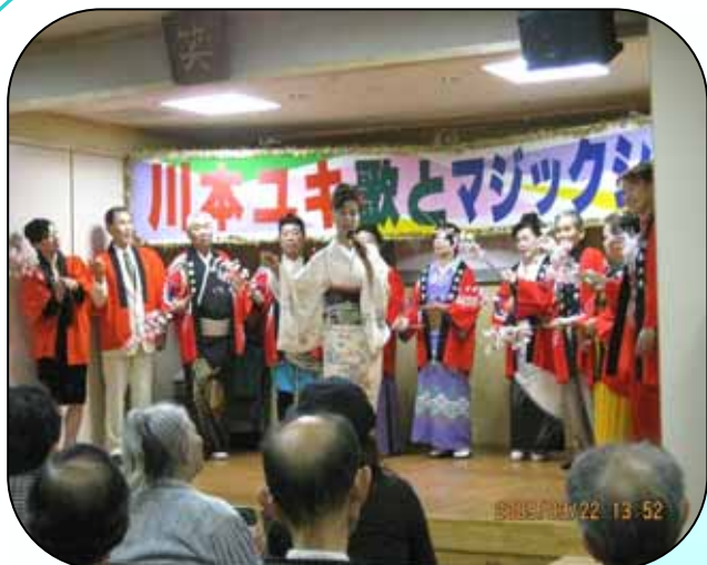
3月22日(日) 開設三周年記念行事