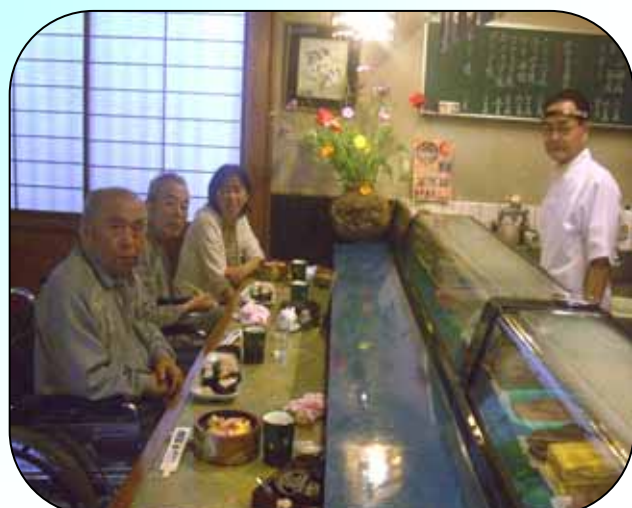
5月12日(火) 浅水町 野平寿司にて (あやめユニット)